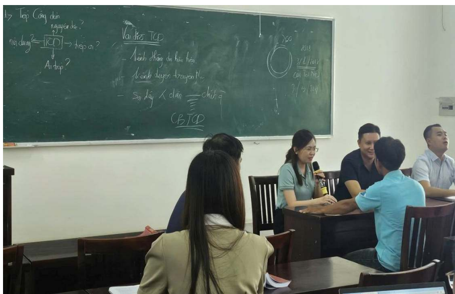
Ảnh: Học viên lớp Trung cấp Lý luận chính trị tập trung khóa 36 thực hiện phương pháp đóng vai tiếp công dân tại Ủy ban nhân dân cấp xã

Qua thực tiễn áp dụng phương pháp đóng vai, giảng viên nhận thấy rằng không khí lớp học sôi nổi, vui tươi hơn rất nhiều, thu hút phần lớn học viên tham gia một cách tích cực dù với tư cách là diễn viên hay khán giả ngồi xem. Sau mỗi buổi diễn, giảng viên sẽ tổ chức cho lớp học nhận xét, đưa ra những lời bình luận về cả ưu điểm, cũng như hạn chế ở từng diễn viên. Để có thể nhập vai vào nhân vật cũng như đưa ra những lời nhận xét xác đáng đòi hỏi người học phải chủ động tìm hiểu kỹ trước kiến thức mới. Như vậy, với phương pháp này, giảng viên sẽ ít mất thời gian để trình bày lý thuyết, đồng thời, người học được thực hành kỹ năng lãnh đạo, quản lý ngay tại lớp.