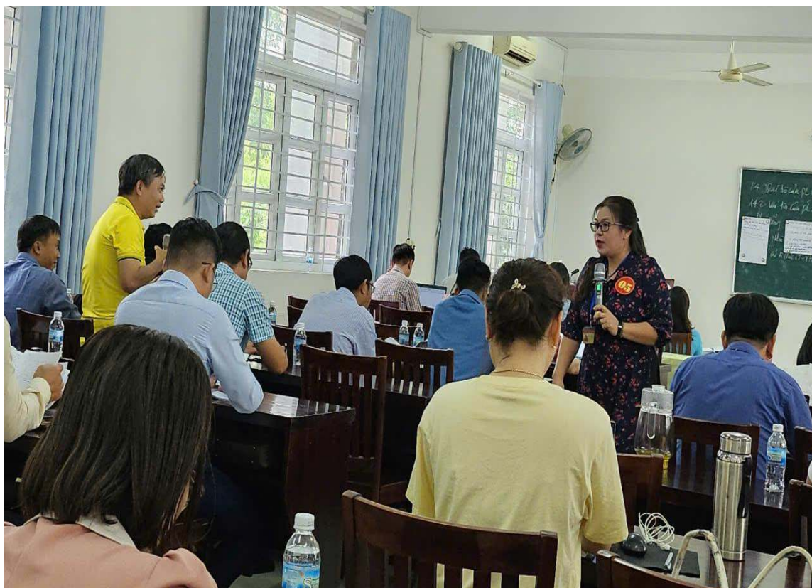
Ảnh: Một tiết giảng tại Hội thi giảng viên dạy giỏi Trường Chính trị tỉnh Khánh Hòa năm 2024

Thứ ba, cần phát huy dân chủ trong sinh hoạt, trao đổi, thảo luận trên lớp.